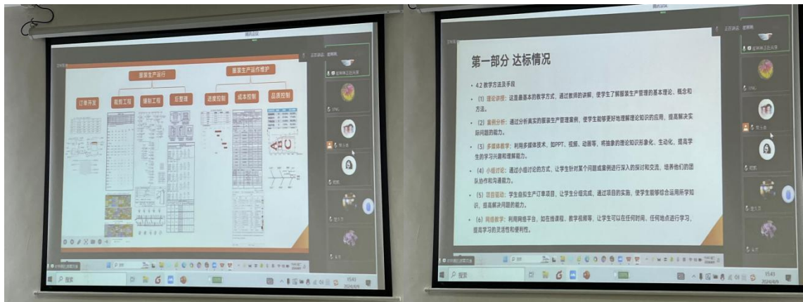
图 2 课程负责人汇报

程资源、教学实施、教学效果和课程特色等 6 个方面依次进行汇报。评委们认真听取了汇报，参照课程评估指标体系和评分标准，在参评课程自评报告的基础上，进行了点评和质询，并提出了许多建设性的意见和建议。