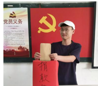
(艺术设计学院学生党支部组织义捐活动)

10月14日上午，时尚传媒学院组织党建联合分会全体成员、19级全体学生与部分辅导员老师，在主教学楼前举行了“不忘初心，牢记使命”主题教育暨“我为祖国升国旗”主题升旗仪式。