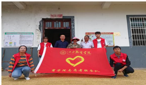
(商学院学生党支部志愿服务活动)

10月9日中午，艺术设计学院学生党支部组织学生党员为社会空巢老人和留守儿童进行义捐活动。