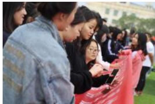
（师生共同签字，表示决心）